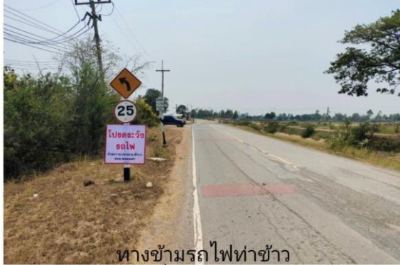
ทางข้ามรถไฟท่าข้าว เฮียตี๋ หนองเต่า ม.1

ระหว่างวันที่ ๑๑ เมษายน ๒๕๖๖ ถึงวันที่ ๑๗ เมษายน ๒๕๖๖