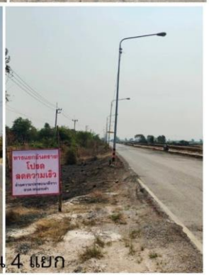
บริเวณ 4 แยก หนองพิกทอง ม.3