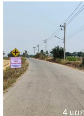
4 แยกป้อปลา หนองเต่า ม.1