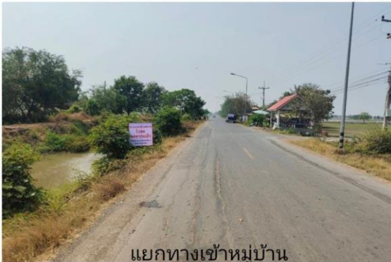
แยกทางเข้าหมู่บ้าน หนองพิกทอง ม.3

โครงการส่งเสริมสนับสนุนการป้องกันและบรรเทาสาธารณภัย กิจกรรมการป้องกันและลดอุบัติเหตุทางถนนช่วงเทศกาลสงกรานต์ พ.ศ. ๒๕๖๖ (ด้านชุมชน ณ สีแยกหนองพิกทอง) ระหว่างวันที่ ๑๑ เมษายน ๒๕๖๖ ถึงวันที่ ๑๗ เมษายน ๒๕๖๖