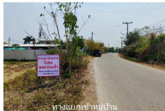
ทางแยกเข้าหมู่บ้าน บ้านลาด ม.5