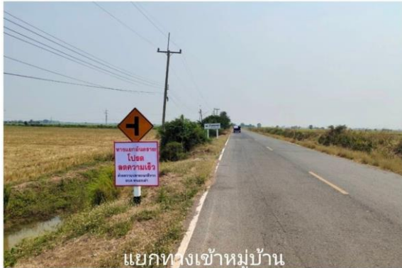
แยกทางเข้าหมู่บ้าน หนองเลา ม.6

ระหว่างวันที่ ๑๑ เมษายน ๒๕๖๖ ถึงวันที่ ๑๗ เมษายน ๒๕๖๖