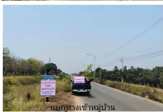
แยกทางเข้าหมู่บ้าน โคกสุข ม.2