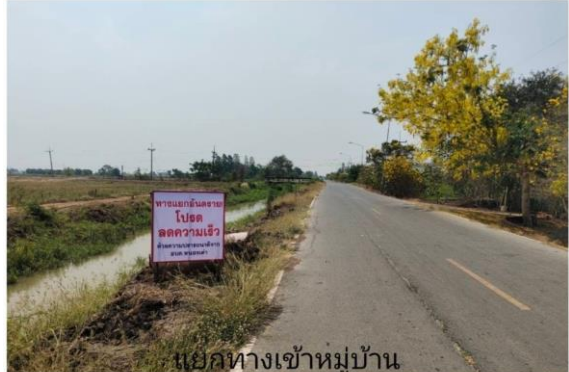
แยกทางเข้าหมู่บ้าน หนองเกี้ยวแพ็ก ม.4