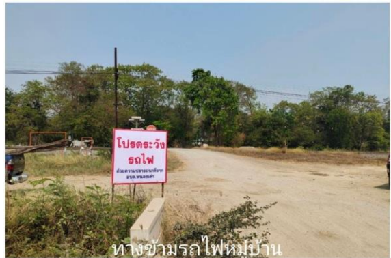
ทางข้ามรถไฟหมู่บ้าน หนองเลา ม.6