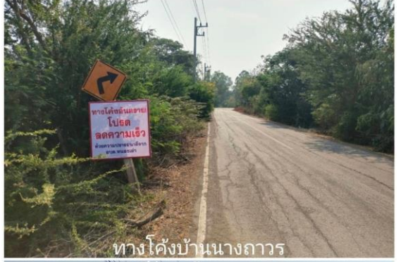
ทางโค้งบ้านนางถาวร คูเย่บ้านบ้านลาด ม.5