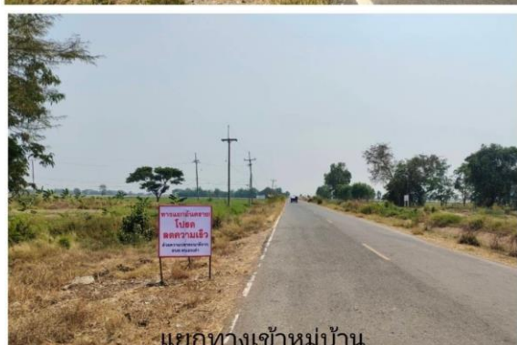
แยกทางเข้าหมู่บ้าน หนองเต่า ม.7